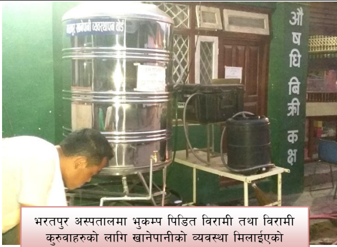
भरतपुर अस्पतालमा भुकम्प पिडित विरामी तथा विरामी कुरुवाहरुको लागि खानेपानीको व्यवस्था मिलाईएको