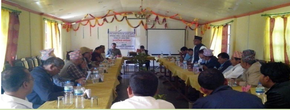
बोर्डको सेवाक्षेत्र भित्रका विभिन्न उपभोक्ता समितिहरु, बोर्ड र खानेपानी तथा ढल निकास विभाग विचको सम्बन्धलाई कसरी व्यवस्थित र संस्थागत गर्ने भन्ने विषयमा राय सुझाव संकलनको लागि आयोजना गरिएको अन्तर्क्रिया कार्यक्रम