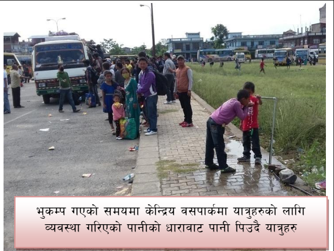
भुकम्प गएको समयमा केन्द्रिय बसपार्कमा यात्रुहरुको लागि व्यवस्था गरिएको पानीको धारावाट पानी पिउदै यात्रुहरु