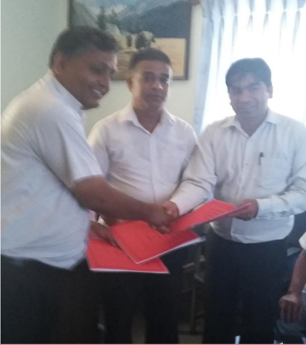
शुसासन परियोजनावाट भ.न.पा. वडा नं. ११ र १२ मा ७ कि.मि. लाईन विस्तार गरी बोर्डलाई हस्तान्तरण गरिदै