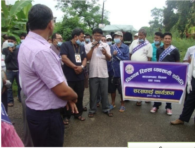
वातावरणीय सरसफाई सम्बन्धि कार्यक्रमका केही भ्रमक