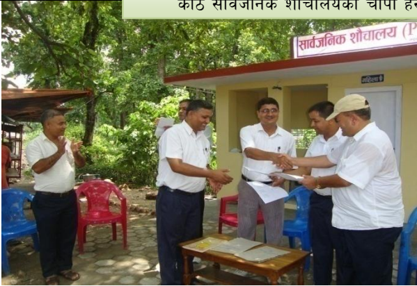
भरतपुर २ आँपटारीमा सर्वसाधारणको लागि निर्माण गरिएको २ कोठे सार्वजनिक शौचालय