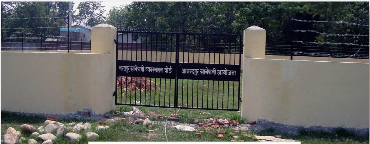
आनन्दपुर खानेपानी आयोजना स्थलमा निर्माण गरिएको कम्पाउण्ड बाल