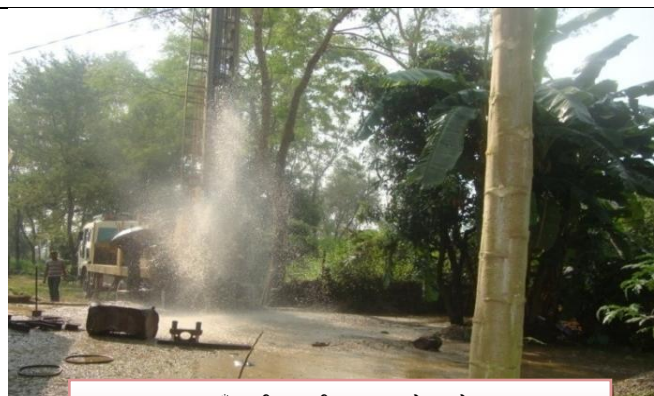
भ.न.पा. २ आँपटारी (माथी) र मालपोत चोक (तल) मा डि.टि.एच. मेसिनबाट डिप वोरिङ गरिदै