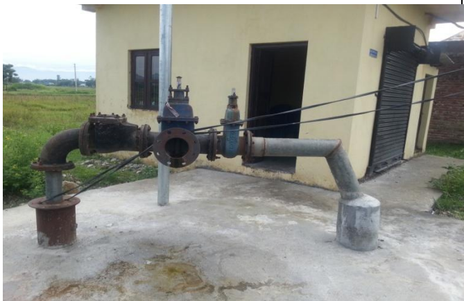
कैलासनगर वेलमा निर्माण गरिएको प्लेटफर्मको दृश्य