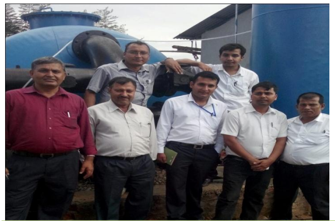
विभिन्न खानेपानी आयोजनाहरूको अवलोकन भ्रमणको एक दृश्य