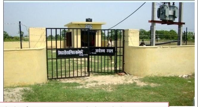
प्रेमवस्ती कालिका खानेपानी आयोजनाको सम्झौता देखी निर्माण सम्पन्न हन लागेको टंकीको दृश्यहरु