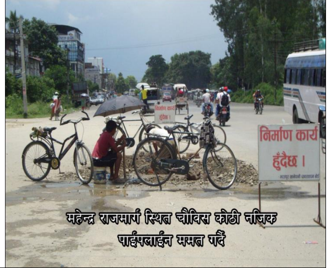
महेन्द्र राजमार्ग स्थित चौदिस ब्रोडी नजिक पाईपलाईन मर्मत गर्दै