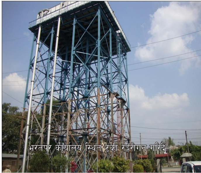
भरतपुर कार्यालय स्थित टुटकी रङ्गरोगन गरिदै