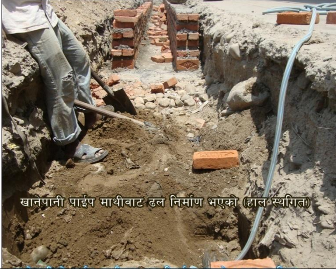
खानेपानी पाईप माथीवाट ढल निर्माण भएको (हाल स्थगित)