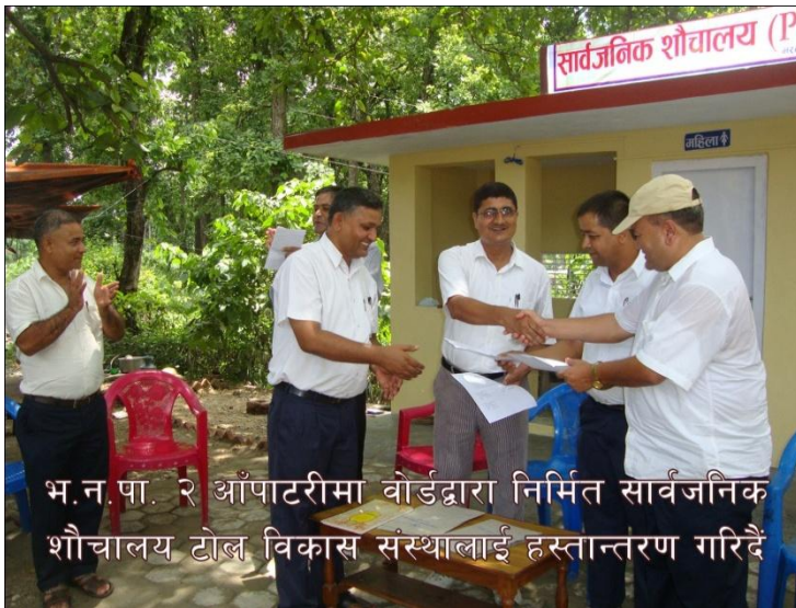
भ.न.पा. २ आँपाटरीमा बोर्डद्वारा निर्मित सार्वजनिक शौचालय टोल विकास संस्थालाई हस्तान्तरण गरिदै