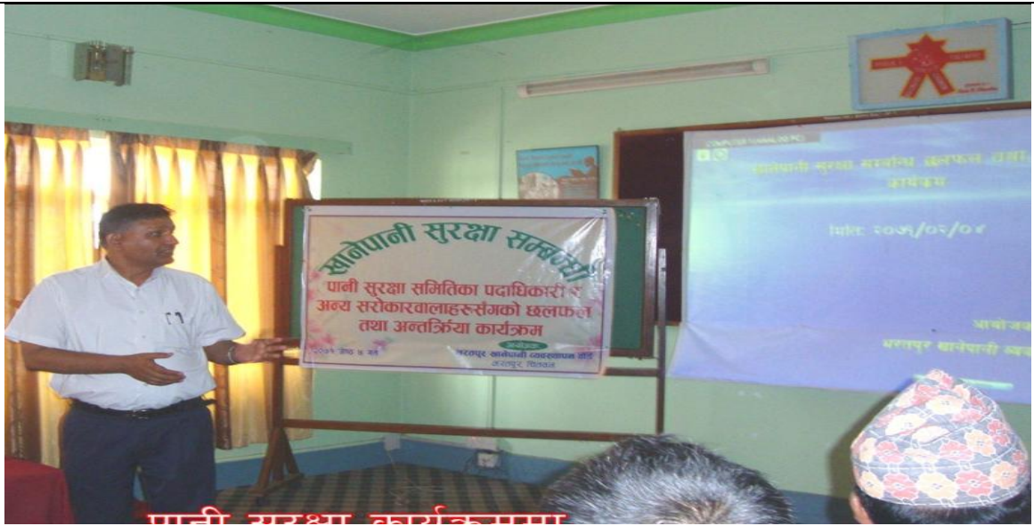
पानी सुरक्षा सम्बन्धि तालिम