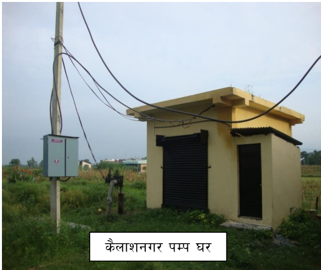
कैलाशनगर पम्प घर