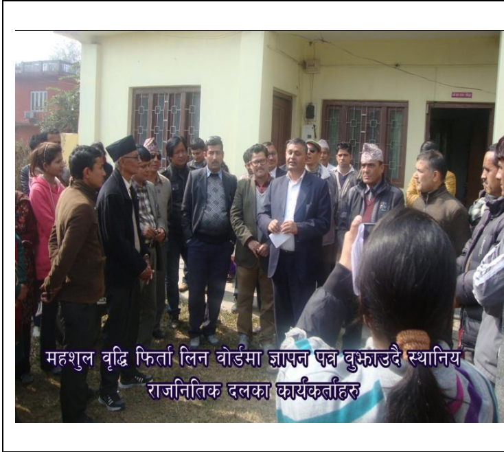
महशुल वृद्धि फिर्ता लिन बोर्डमा ज्ञापन पत्र बुझाउँदै स्थानिय राजनितिक दलका कार्यकर्ताहरु