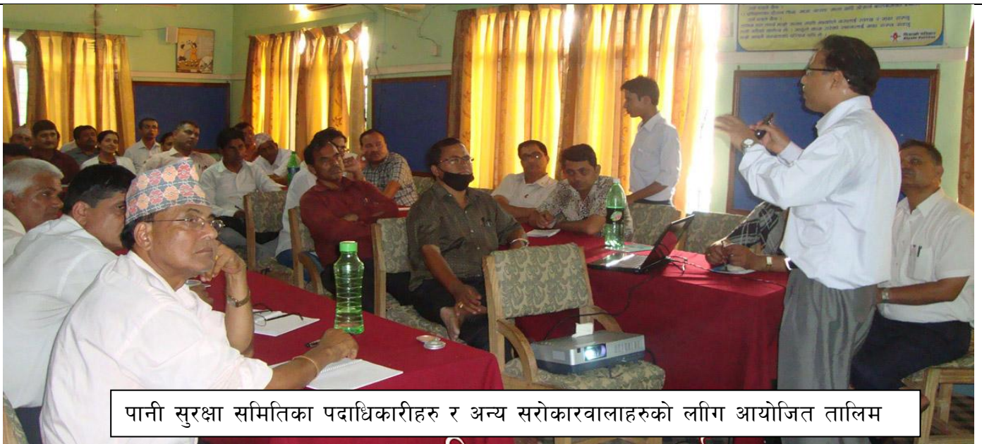
पानी सुरक्षा समितिका पदाधिकारीहरु र अन्य सरोकारवालाहरुको लागि आयोजित तालिम