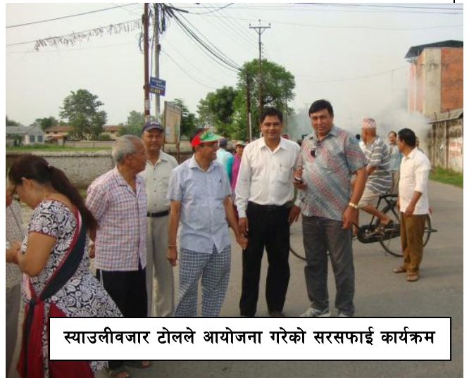
स्याउलीवजार टोलले आयोजना गरेको सरसफाई कार्यक्रम