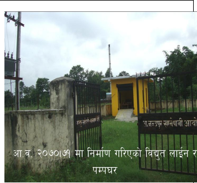
आ व. २०७०।७१ मा निर्माण गरिएको विद्युत लाईन र पम्पघर