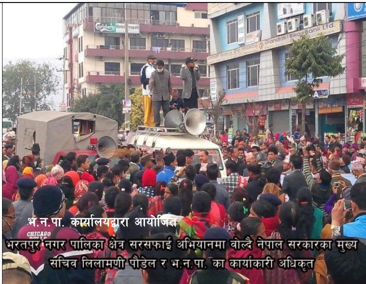
भ.न.पा. कार्यालयद्वारा आयोजित भरतपुर नगर पालिका क्षेत्र सरसफाई अभियानमा बोल्दै नेपाल सरकारका मुख्य सचिव लिलामणी पौडेल र भ.न.पा. का कार्यकारी अधिकृत