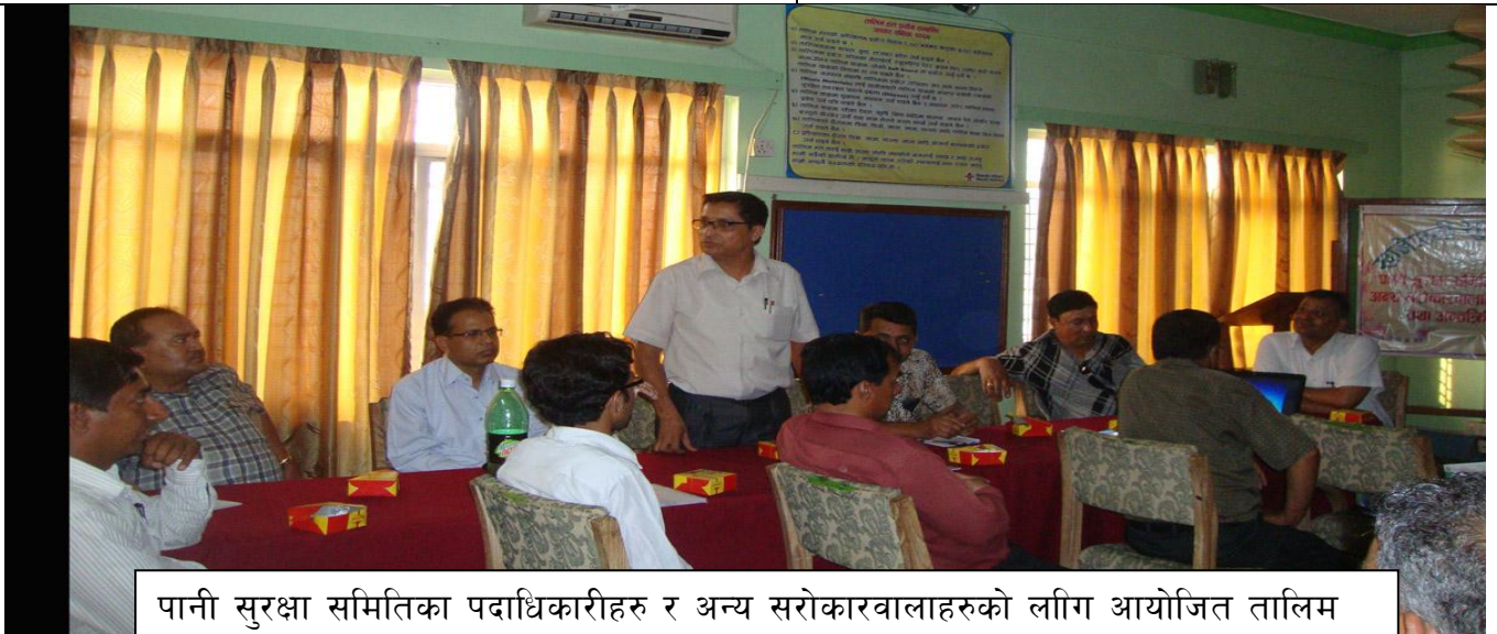
पानी सुरक्षा समितिका पदाधिकारीहरु र अन्य सरोकारवालाहरुको लागि आयोजित तालिम