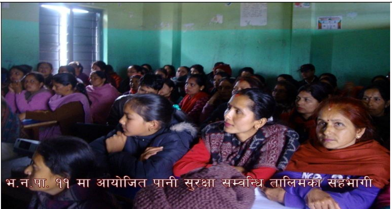
भ.न.पा. ११ मा आयोजित पानी सुरक्षा सम्बन्धि तालिमको सहभागी