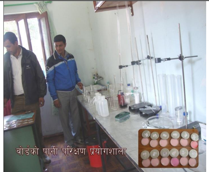
बोर्डको पानी परिक्षण प्रयोगशाला