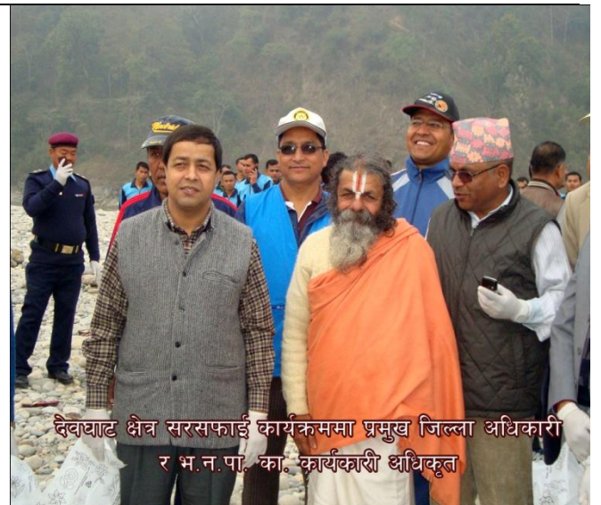
देवघाट क्षेत्र सरसफाई कार्यक्रममा प्रमुख जिल्ला अधिकारी र भ.न.पा. का कार्यकारी अधिकृत