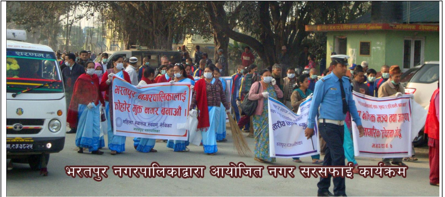
भरतपुर नगरपालिकाद्वारा आयोजित नगर सरसफाई कार्यक्रम