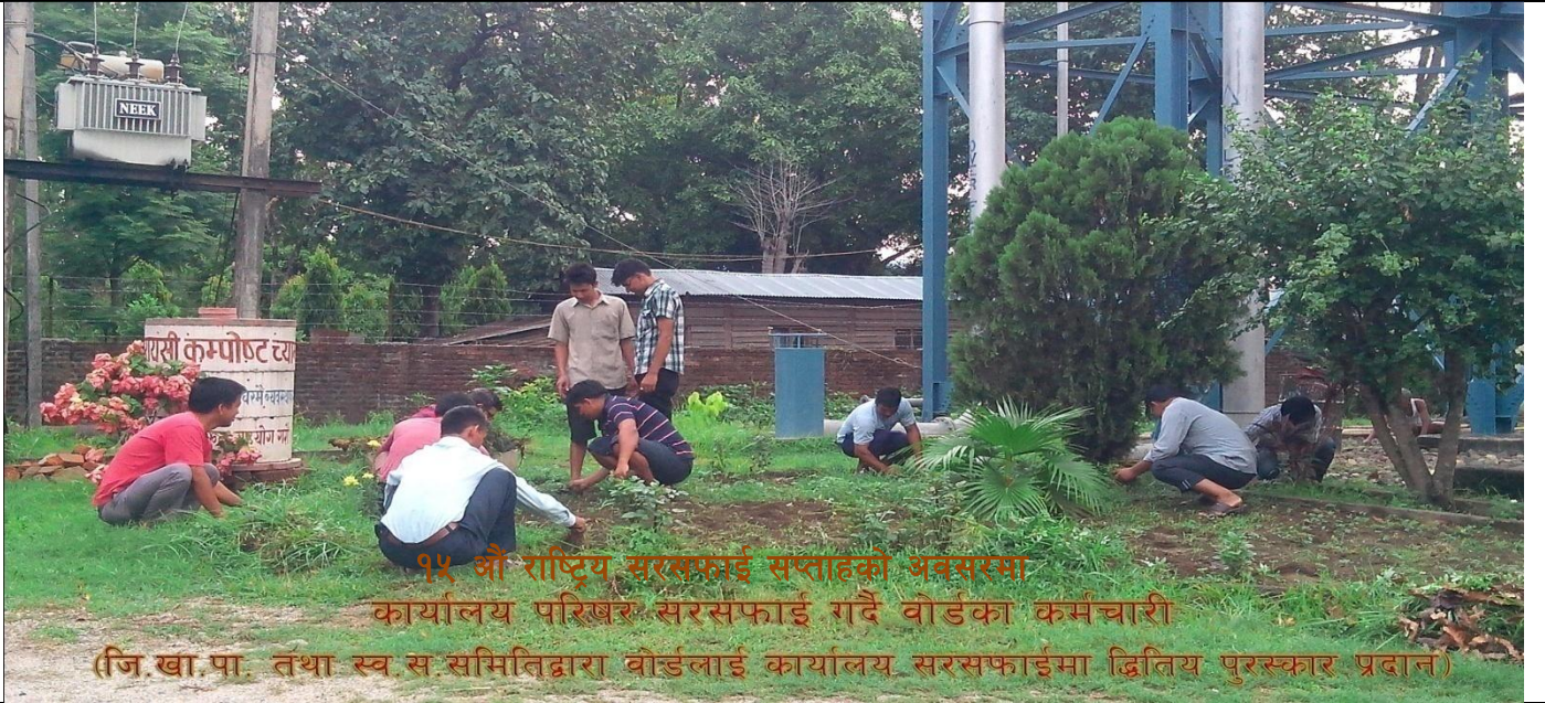
१५ औं राष्ट्रिय सरसफाई सप्ताहको अवसरमा कार्यालय परिसर सरसफाई गर्दै वौडका कर्मचारी (जि.खा.पा. तथा स्व.स.समितिद्वारा वौडलाई कार्यालय सरसफाईमा द्वितीय पुरस्कार प्रदान)