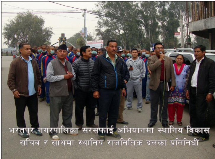
भरतपुर नगरपालिका सरसफाई अभियानमा स्थानिय विकास सचिव र साथमा स्थानिय राजनितिक दलका प्रतिनिधी