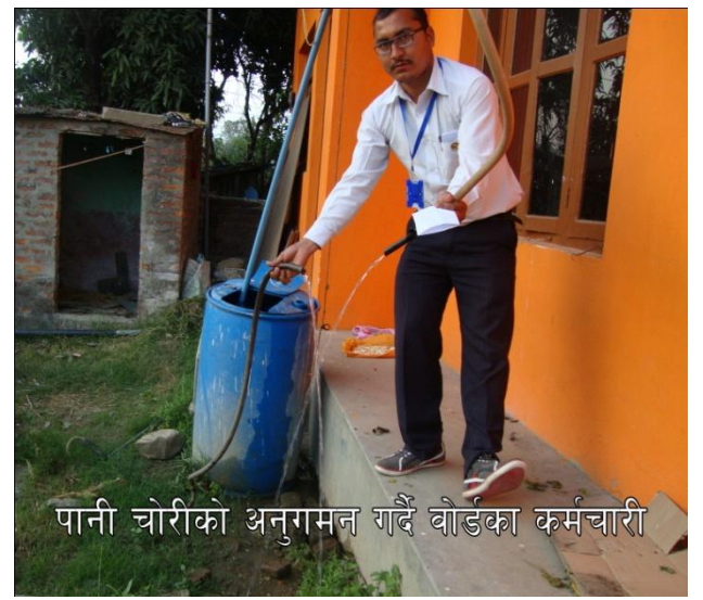
पानी चोरीको अनुगमन गर्दै बोर्डका कर्मचारी