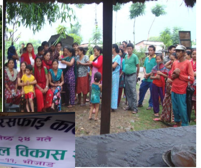
सिर्जुली सरसफाई कार्यक्रम २०७२ जेष्ठ २४ गते नव जीवन टोल विकास भ.न.पा.-११, भोजाड